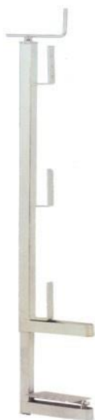
Figura 1- Parapetto universale a vite